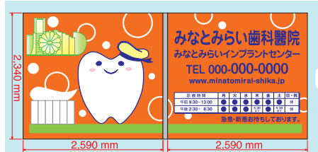
レイアウトデザイン