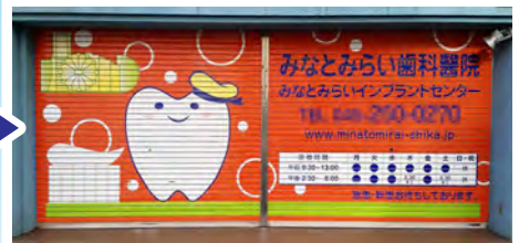
シャッターラッピング施工

店舗シャッターや壁面、窓、ドア、柱など、さまざまな面(めん)をメディアとして、 お客様が伝えたいこと、伝えたいイメージを表現いたします。