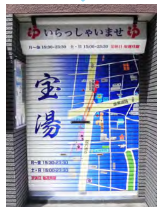
Step 7 シャッターラッピング施工