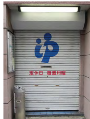
Step 2 現調確認